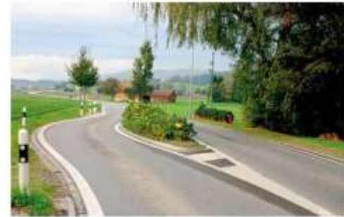
Abb. 86: Oetikon, Einfahrtsbremse (Blick dorfsauwärts)