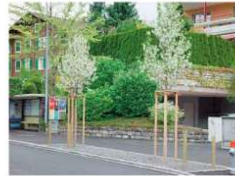
Abb. 85: Horn Zentrum, Baumscheiben